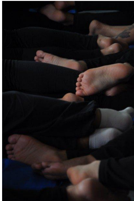
สภาพเท้าของผู้ต้องขังหญิงขณะนอนที่ต้องสับและเกยกันไปมาเนื่องจากมีพื้นที่ที่จำกัดมาก